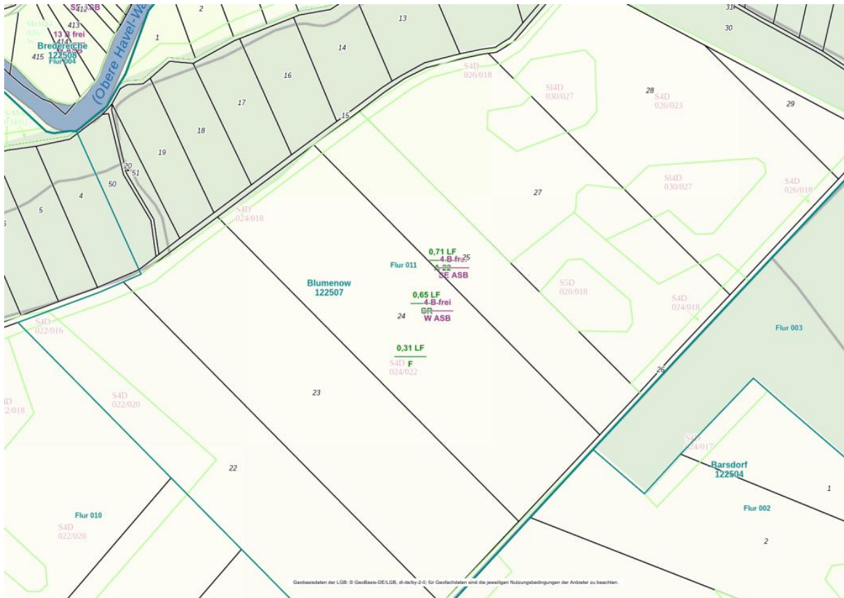
Abbildung 3: Darstellung des Bodenwerts.