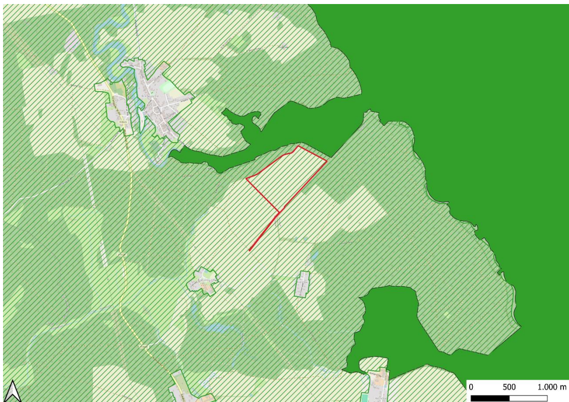
Abbildung 2: Landschaftsschutzgebiete; Plangebiet mit rot gekennzeichnet.

Der Geltungsbereich des Bebauungsplans befindet sich vollständig im Landschaftsschutzgebiet „Fürstenberger Wald- und Seengebiete“ (in Abb. 3 gekennzeichnet).