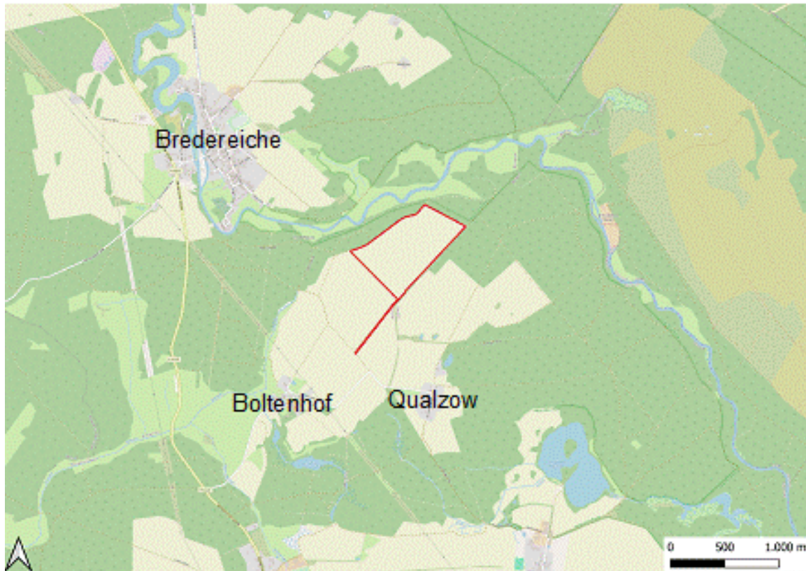
Abbildung 1: Lage der Vorhabenfläche (rot).

Der räumliche Geltungsbereich des Solarpark umfasst folgende Flurstücke in der Gemarkung Blumenow; Flur: 11; Flurstücke: 22, 23, 24, 25, 27, 28, 29. Dazu kommen die Wegeflurstücke der Erschließung 25/1 (tlw.) und 25/2 der Gemarkung Blumenow, Flur 10 sowie das Flurstück 26 (tlw.) der Gemarkung Blumenow, Flur 11.