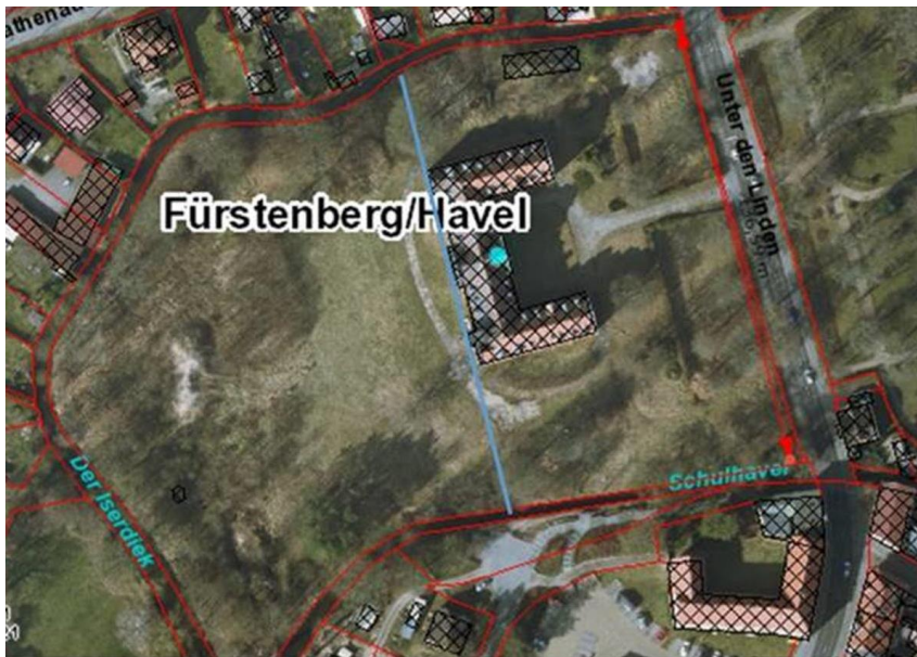
Abb. 1 – Darstellung Landkreis Oberhavel zum Innen- und Außenbereich

Mittels des „Bebauungsplans unter Einbeziehung von Außenbereichsflächen in das beschleunigte Verfahren“ gemäß § 13b BauGB (siehe Kap. I.2.) können Teile eines im Ortsinneren liegenden Gebiets, die derzeit als Außenbereich gemäß § 35 BauGB anzusehen sind, einer geordneten städtebaulichen Entwicklung zugeführt werden. So kann die innerstädtische Brachfläche im Sinne des § 1a Abs. 2 Satz 1 BauGB einer neuen Nutzung zugeführt werden. Dabei dient das im Innenbereich liegende bestehende Schlossgebäude, welches nach § 13a BauGB entwickelt wird, für die dahinterliegende neue Wohnbebauung als erschließendes Grundstück und versorgt das ganze Gebiet mit Stellplätzen. Über die geplante private Grünanlage besteht eine weitere Wechselwirkung zwischen den beiden Gebieten. Beide Flächen gehören einem bau-träger, der für die Gesamtentwicklung der einheitlich geplanten Entwicklung einen städtebaulichen Vertrag mit der Gemeinde schließen wird. Aus diesem Grund wurde entschieden, dass die Fläche in einem Verfahren beplant wird.