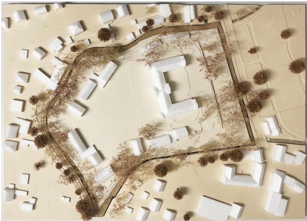
Abb. 2 – Modellansicht von oben

Für das Schloss Fürstenberg wurde bereits ein Bauantrag gestellt, welcher die Schaffung von 43 Wohneinheiten vorsieht. In den Neubauten sollen voraussichtlich dreigeschossige Maisonettewohnungen entstehen. Hier entsteht eine Geschossfläche von ca. 6.800 m 2 (zulässige Grundfläche abzüglich der Terrassen mal drei Vollgeschosse, wovon das oberste als Dachgeschoss auszubilden ist). Bei einer durchschnittlichen rechnerischen Geschossfläche werden von ca. 170 m 2 je Wohneinheit (Geschossfläche größer als Wohnfläche; es wird später Erschließungs- Konstruktionsfläche abgezogen) bieten die Neubauten Potenzial für ca. 40 Wohneinheiten. Insgesamt könnten somit ca. 83 neue Wohneinheiten entstehen.