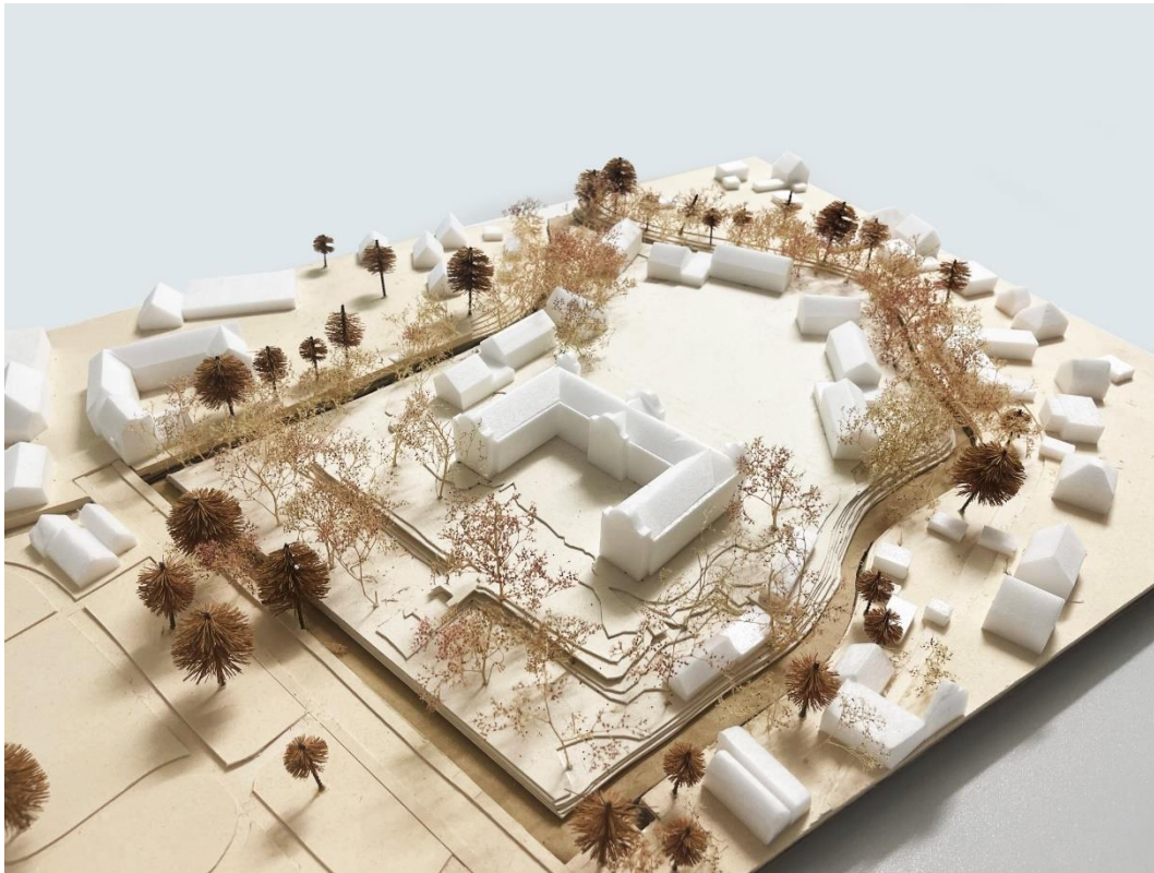
Abb. 3 – Modellansicht von Nordosten