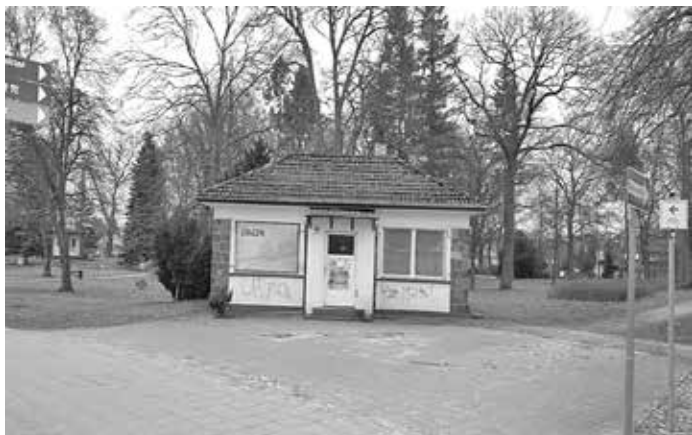
Nordseite des Funktionsgebäudes

Bei dieser Ausschreibung handelt es sich um eine unverbindliche Aufforderung zur Abgabe von Geboten, die nicht den Bestimmungen VOB/ VOL unterliegen. Die Entscheidung der Stadt Fürstenberg/ Havel, ob, wann, an wen und zu welchen Konditionen verkauft wird, ist frei bleibend.