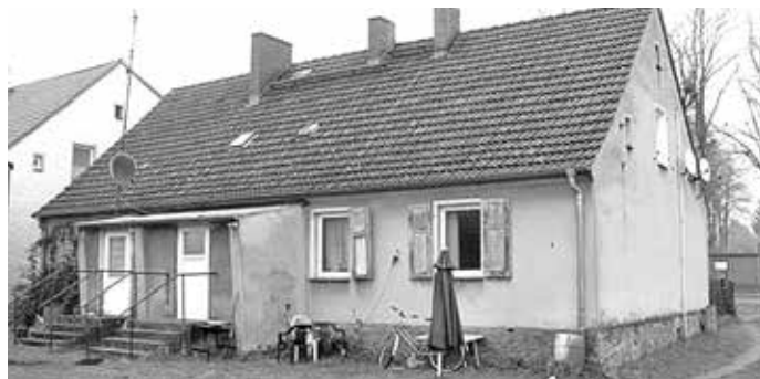
hofseitige Grundstücks- und Gebäudeansicht