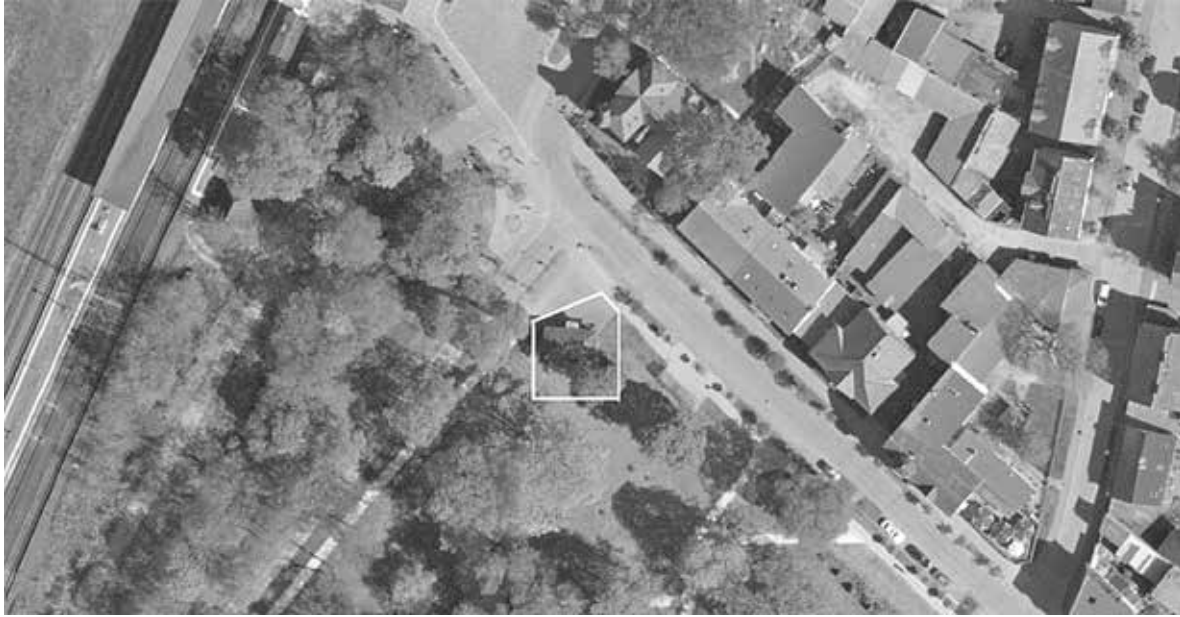
Kartenauszug – Gemarkung Fürstenberg/Havel, Flur 20, Flurstück 597