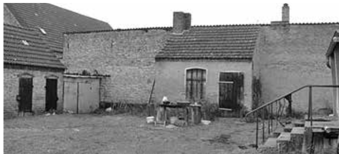
Ansicht massive Schuppenanlagen