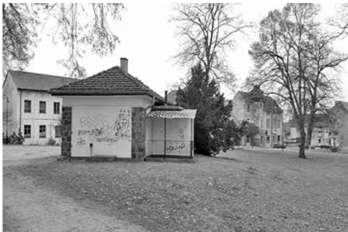
Blick von der Schützenstraße