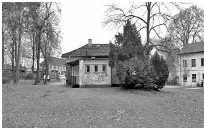
Südseite des Funktionsgebäudes