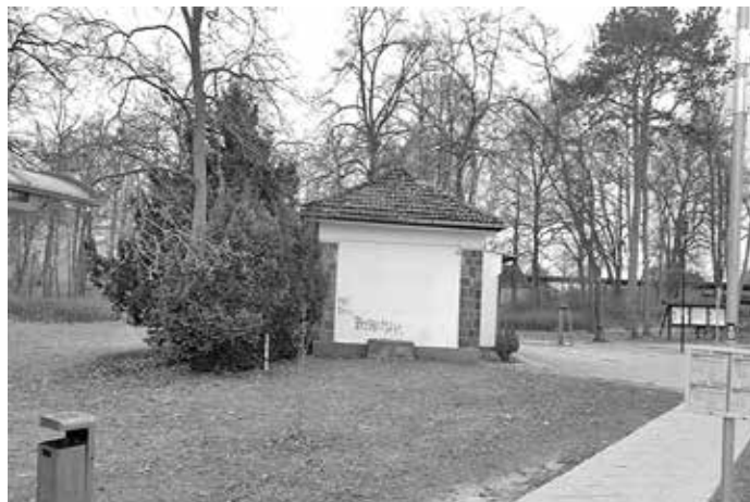
Blick von der Bahnhofstraße