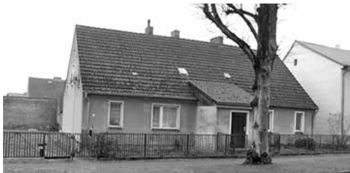
straßenseitige Grundstücks- und Gebäudeansicht

Bei dieser Ausschreibung handelt es sich um eine unverbindliche Aufforderung zur Abgabe von Geboten, die nicht den Bestimmungen VOB/ VOL unterliegen. Die Entscheidung der Stadt Fürstenberg/ Havel, ob, wann, an wen und zu welchen Konditionen verkauft wird, ist frei bleibend.