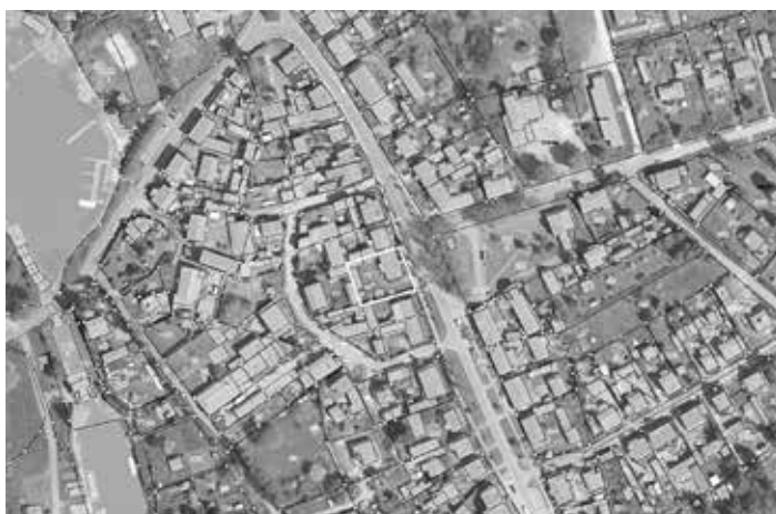
Kartenauszug Gemarkung Bredereiche Flur 4, Flurstück 43