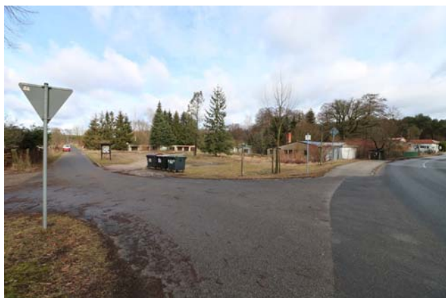
Blick von der Ravensbrücker Dorfstraße in Richtung Weidendamm